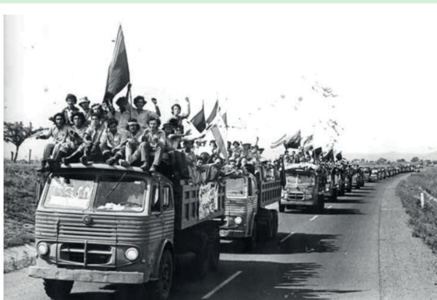
El retorno triunfal de los brigadistas en agosto de 1980.

Hemos regresado los brigadistas a nuestros hogares. ¡Hemos Cumplido fue la Consigna!.