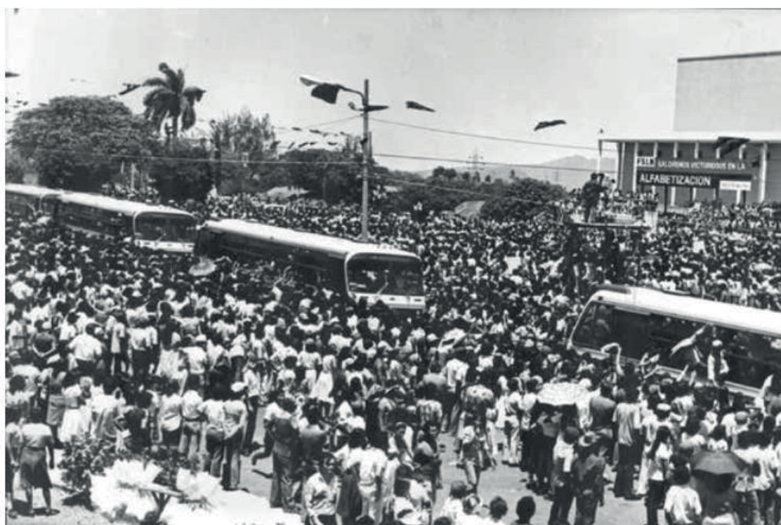
La despedida a los brigadistas en la Plaza de la Revolución, en marzo de 1980.

Por la mañana nos entregaron ordenadamente nuestros uniformes de brigadistas, que consiste en una cotona ploma clara, con el distintivo de Alfabetizador bordado en vistosos colores rojo y negro, y un pantalón azulón. Desfilamos a tomar los camiones y ya subidos a estos, cantamos con emoción nuestro Himno de Alfabetización.