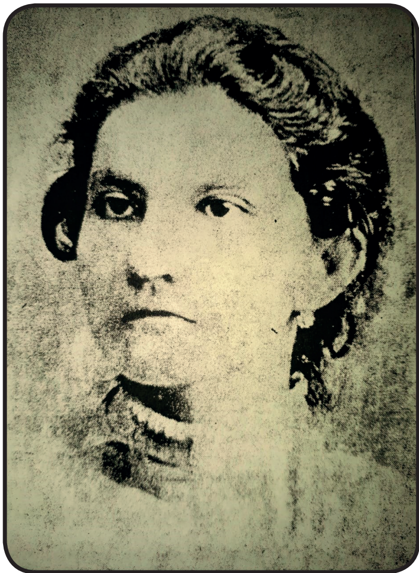
Fotografía de Josefa Toledo de Aguerri, tomada en 1887 en Granada. Localizada en el Libro de Oro: Homenaje y admiración (Managua: Talleres Gráficos San Antonio, 1956).