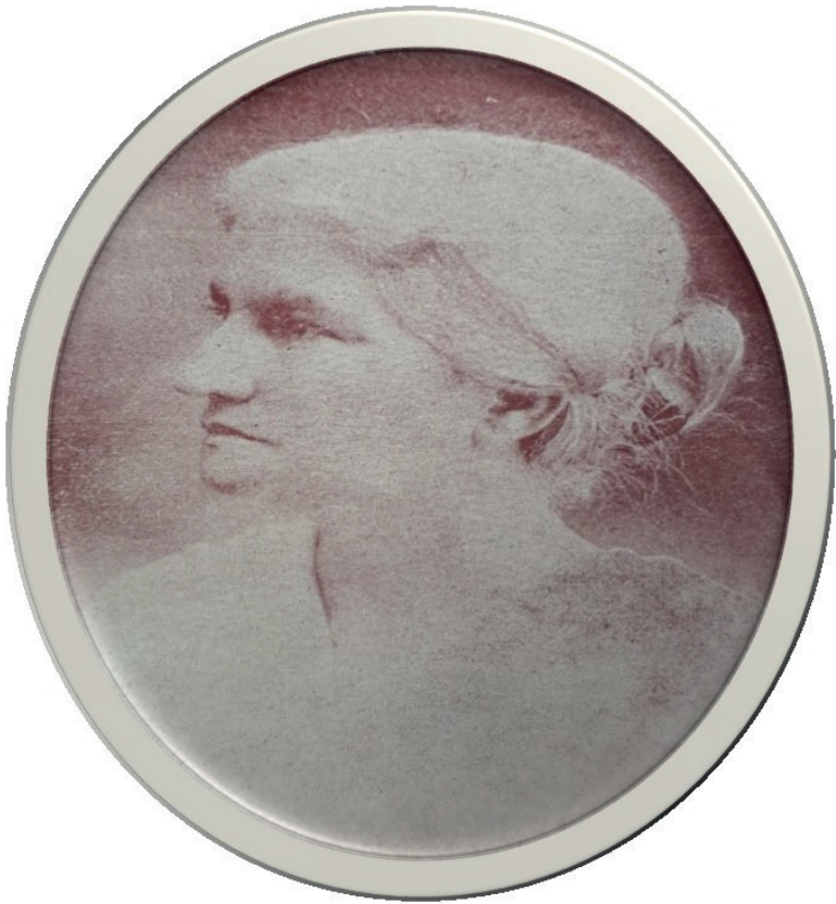
Fotografía de Josefa Toledo de Aguerri, tomada de Al correr de la pluma, Crónicas de viajes escrita para la Revista Femenina (Managua: Tipografía y Encuadernación Nacional, 1926).