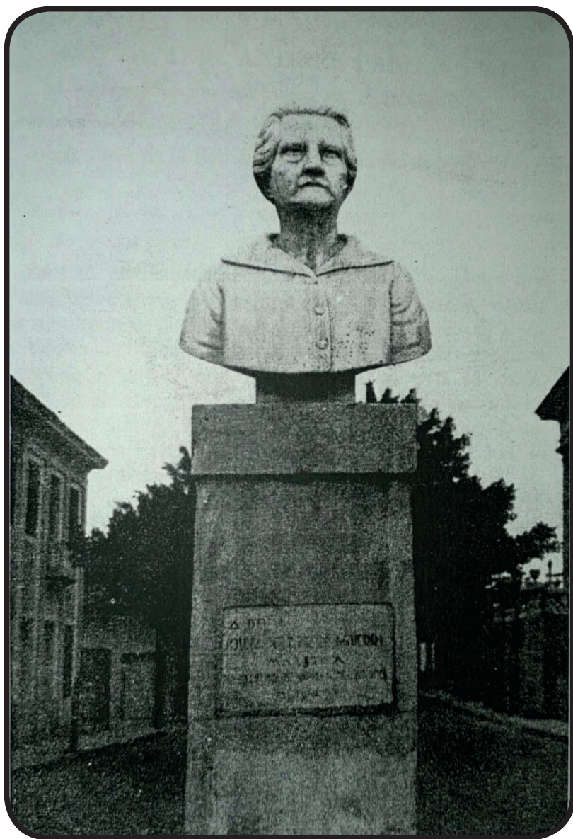
Busto de mármol de Josefa Toledo de Aguerri. Erigido en el Parque Central de Mangua.