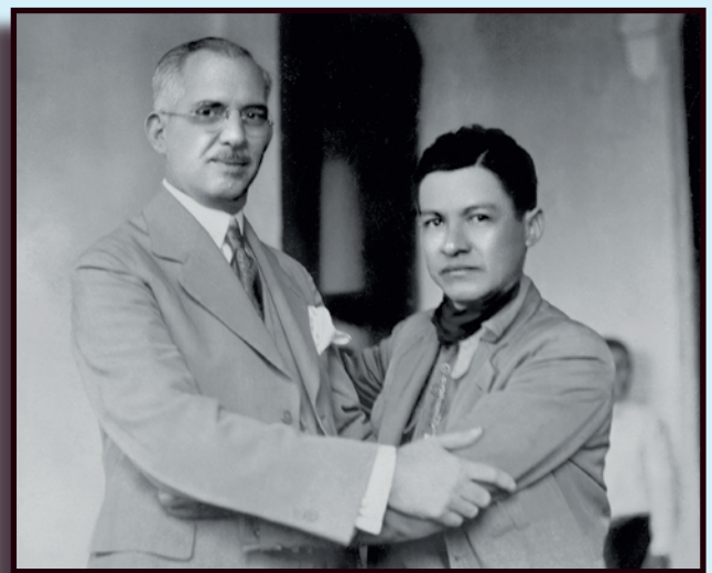
El general A. C. Sandino y el Presidente Juan Bautista Sacasa, poco tiempo después de haber suscrito el Convenio de Paz en Febrero de 1933.

Fue durante este gobierno liberal que se retiraron los Yankes de Nicaragua, al menos en cuanto a la presencia militar directa se refiere; El General Sandino pactó la paz con Sacasa (2 de febrero de 1933), e inició el proceso de desarme gradual durante 1933; Y el Jefe de la Guardia Nacional, Anastasio Somoza García, planeó el asesinato del General Sandino, hecho sucedido el 21 de febrero de 1934 en Managua; Luego, comenzaría la enconada lucha de Sacasa por evitar el ascenso de Somoza al poder, no consiguiéndolo y teniendo que renunciar a la Presidencia en 1936, dando paso a una nueva dictadura militar y dinástica.