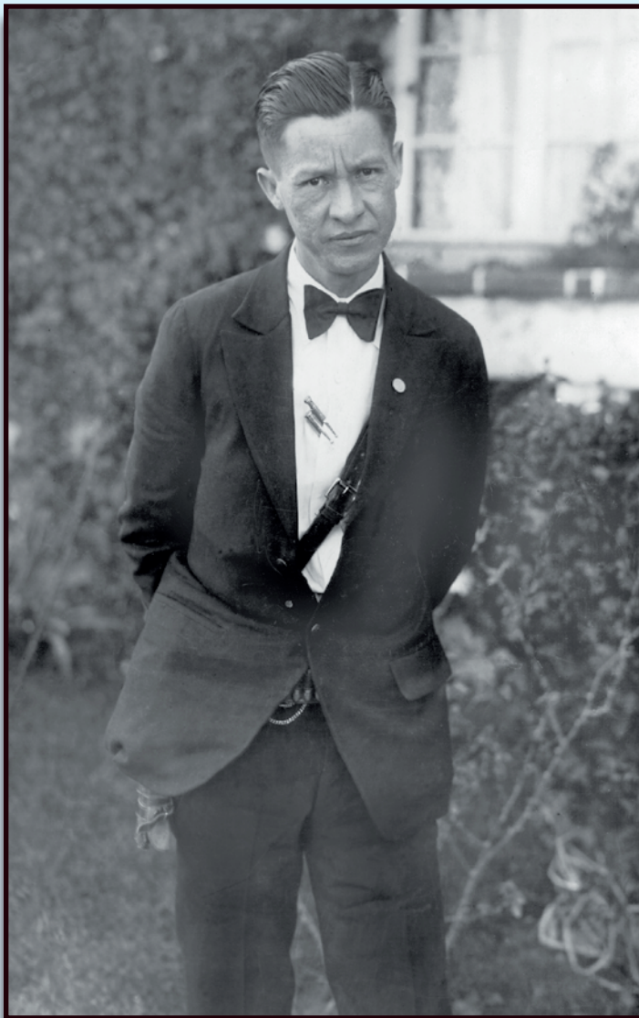
General Augusto César Sandino, México 1930.

¿Qué papel jugó el Congreso Nacional en esta etapa histórica tan importante en la historia política de Nicaragua?. En este capítulo analizaremos su posición ante el asesinato de Sandino y también durante la crisis de 1936 que concluyó con la renuncia del Presidente Sacasa.