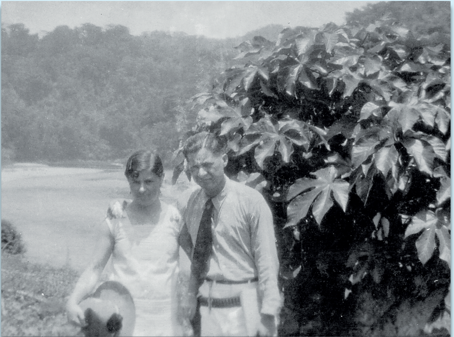
El General Sandino junto a su esposa Blanca Aráuz. Al fondo podemos apreciar el Río Coco (1932).