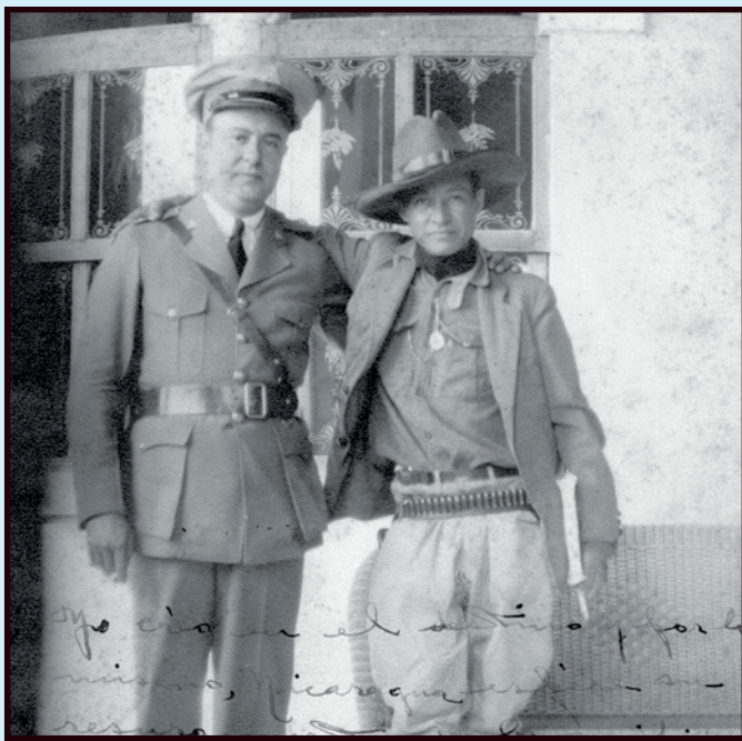
General A. Somoza García, Jefe Director de la Guardia Nacional y el General Augusto C. Sandino en Casa Presidencial después de firmar los convenios de paz el 2 de febrero de 1933, Managua.

En todo este proceso, el Congreso Nacional no tuvo participación de forma Institucional. Fue a través de los representantes de los Partidos Políticos Liberal y Conservador que se hicieron presentes en las negociaciones de paz. Sin embargo, no hay una sesión del Congreso que sancionara la paz suscrita entre el Presidente Sacasa y Sandino.