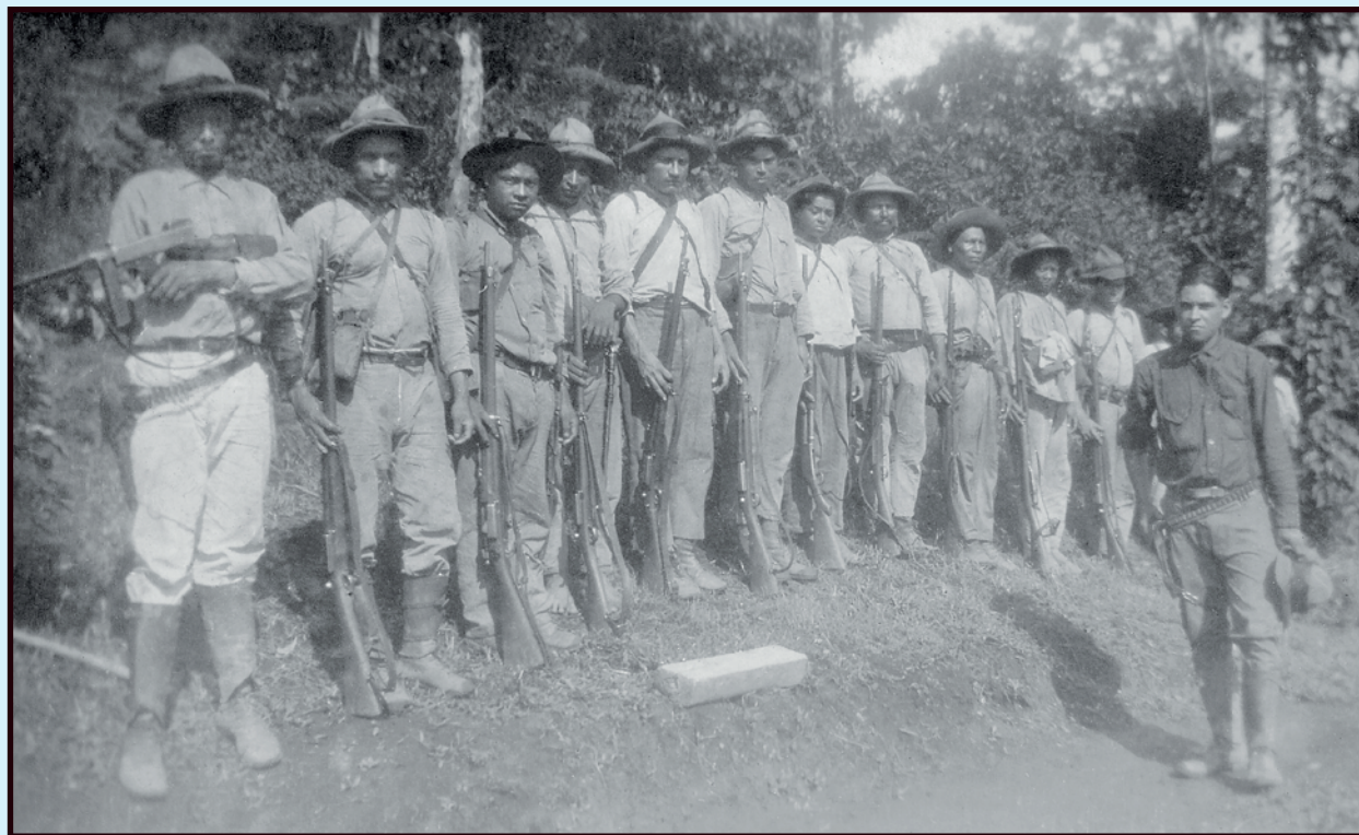
General Francisco Estrada pasando revista a columna sandinista, 1933.

Después de esta derrota militar el Presidente Sacasa presentó su formal renuncia ante el Congreso Nacional de Nicaragua, con fecha 6 de junio de 1936, siguiendo las normas Constitucionales, Julián Irías, el Ministro de Gobernación, le dirigió carta a Roberto Espinosa el Vicepresidente de la República, para que asumiera el cargo, lo cual por supuesto no sucedió, por lo que el Ministro remitió el caso al Congreso Nacional, donde la