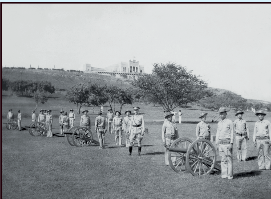
Explanada de la Loma de Tiscapa en tiempos de la intervención norteamericana de 1927, Managua.

“El Gobierno que tengo el honor de presidir concentrará primordialmente sus esfuerzos a obtener el ansiado bien de la pacificación. A este efecto, estará dispuesto a ensayar todos los medios de persuasión compatibles con su dignidad, contando desde luego con el apoyo decidido del Partido Liberal, que me ha llevado al poder, y con la ayuda leal del Partido Conservador, tal como está consignada patrióticamente en los convenios de ambos partidos, celebrados en la semana anterior a las elecciones. Pienso que el primer servicio que el gobierno debe a la nación es devolver la garantía de la vida y de prosperidad, la tranquilidad en una palabra, a aquellos departamentos; y mi gobierno no dejará de llenar este deber, aunque para ello sea necesario empeñar con mayor intensidad el uso de la fuerza armada” .