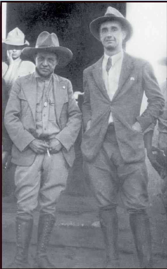
El General Augusto C. Sandino junto al periodista español Ramón de Belausteguigoitia en San Rafael del Norte, 1933.

“Pero como la Cámara de Diputados excita al Senado a proceder en un sentido de mayor acuerpamiento a esa autoridad del Presidente, el Senado de la República en el deseo de asumir una actitud digna y decidida frente a la situación actual: