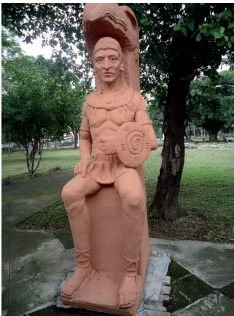
VISTA FRONTAL COMPLETA DEL MONUMENTO. ESCULTOR: SÓCRATES MARTÍNEZ. 12 de Octubre del año 2012. Managua, Nicaragua.