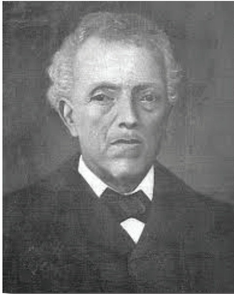
Jose Dolores Estrada.

Dos días después, no necesariamente como consecuencia de este pacto, pero sí coincidente en los tiempos, una fuerza militar de Walker fue derrotada por soldados Legitimistas al mando del Coronel José Dolores Estrada, en la Hacienda San Jacinto. Un 14 de Septiembre, dando paso a un impulso nuevo en el ánimo de las tropas Nicaragüenses.