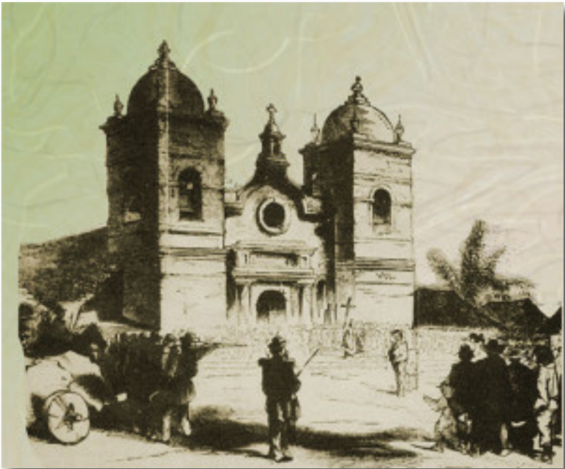
Fusilamiento de Ponciano Corral.

Patricio Rivas, fue instalado en calidad de Presidente Provisorio, desarticulándose los grupos armados Legitimistas y Democráticos, quedando solamente la Falange de William Walker como única fuerza militar, con Walker como Supremo Comandante.