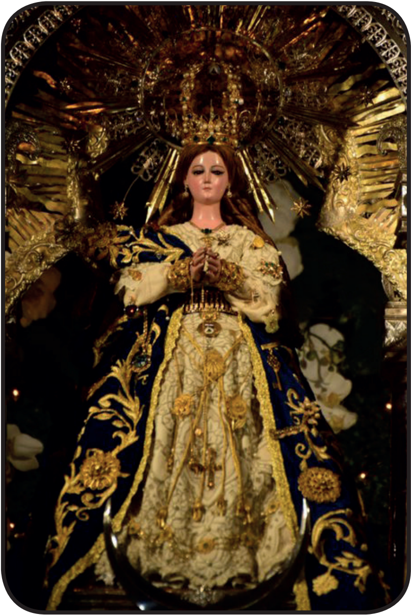
20. La Inmaculada Concepción de María.

https://twitter.com/Canal4Ni/status/1070700914527399937/photo/2