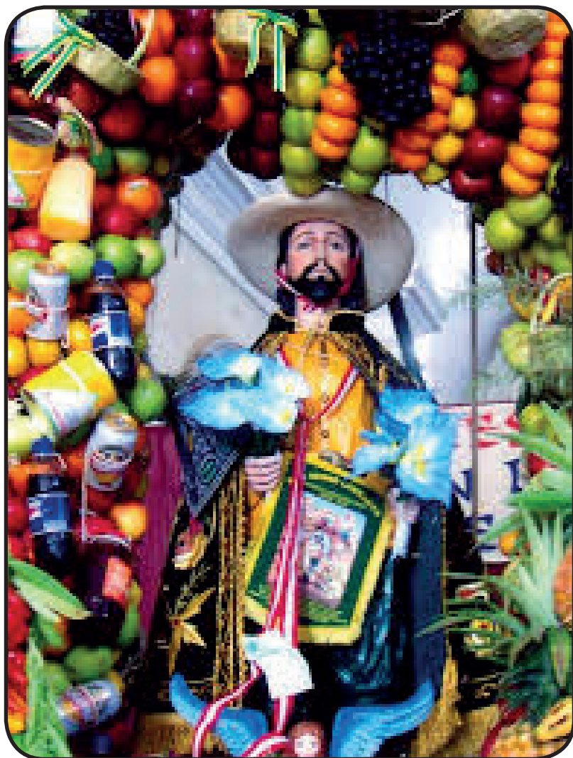
1. San Isidro Labrador.

https://nuevaya.com.ni/jinoteganos-calientan-motores-de-cara-a-celebracion-de-san-isidro-labrador/