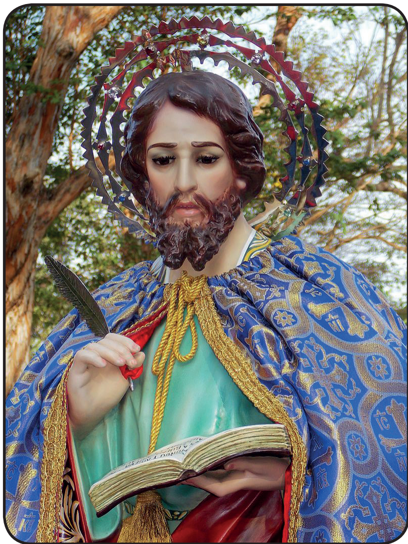
19. San Marcos.

https://es.wikipedia.org/wiki/San_Marcos_(Nicaragua)