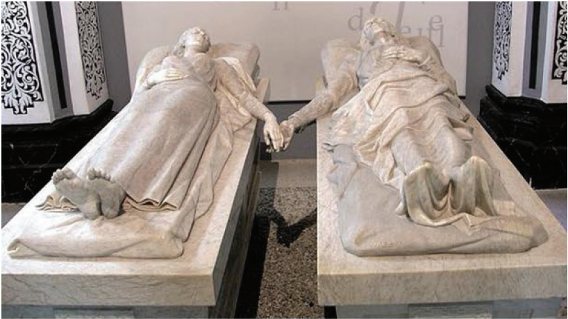
(Los Amantes de Teruel)