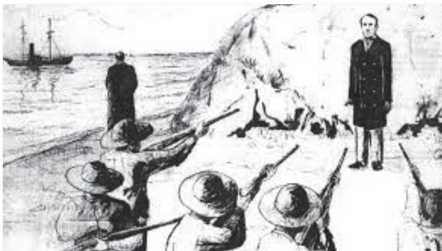
Walker fusilado en Trujillo, Honduras. 12 septiembre 1860.