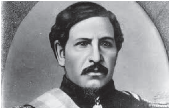
General Mariano Paredes, Presidente de Guatemala fallecido en Granada, Noviembre 1856