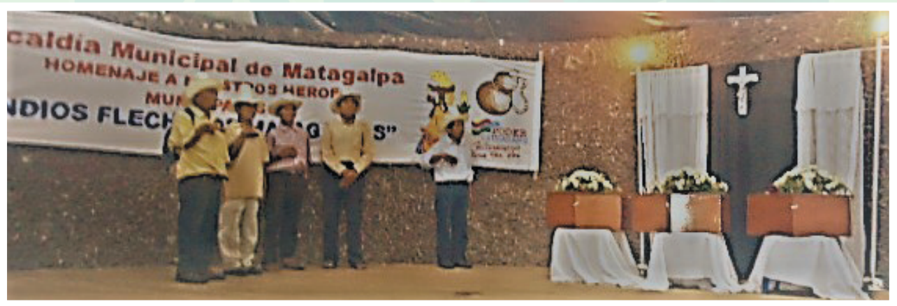
El Consejo de Ancianos de Matagalpa, Matagalpa, rinde guardia de honor a sus ancestros muertos en la batalla de San Jacinto. Ciudad de Matagalpa.