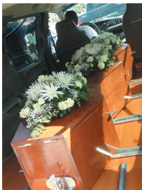
Los tres féretros, dos identificados como indios Matagalpa y uno sin identificar plenamente, son conducidos en el coche fúnebre hacia Matagalpa.