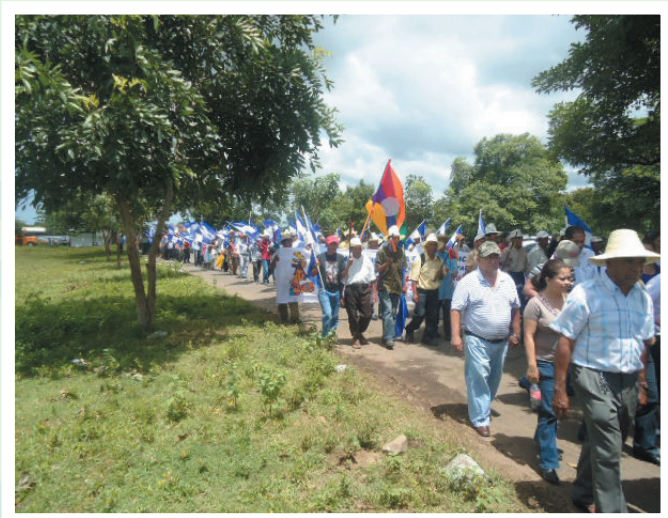
La comunidad indígena Matagalpa, ingresa a la Casa Hacienda San Jacinto.