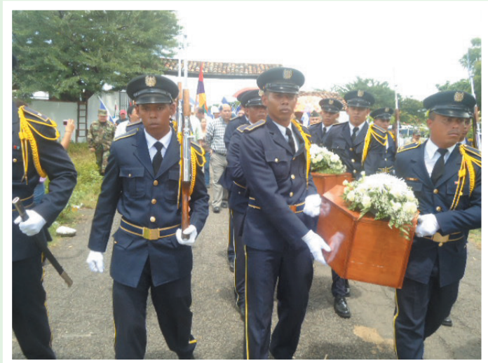
Cuerpo de Cadetes del Ejército de Nicaragua ingresa a la Casa Hacienda San Jacinto.