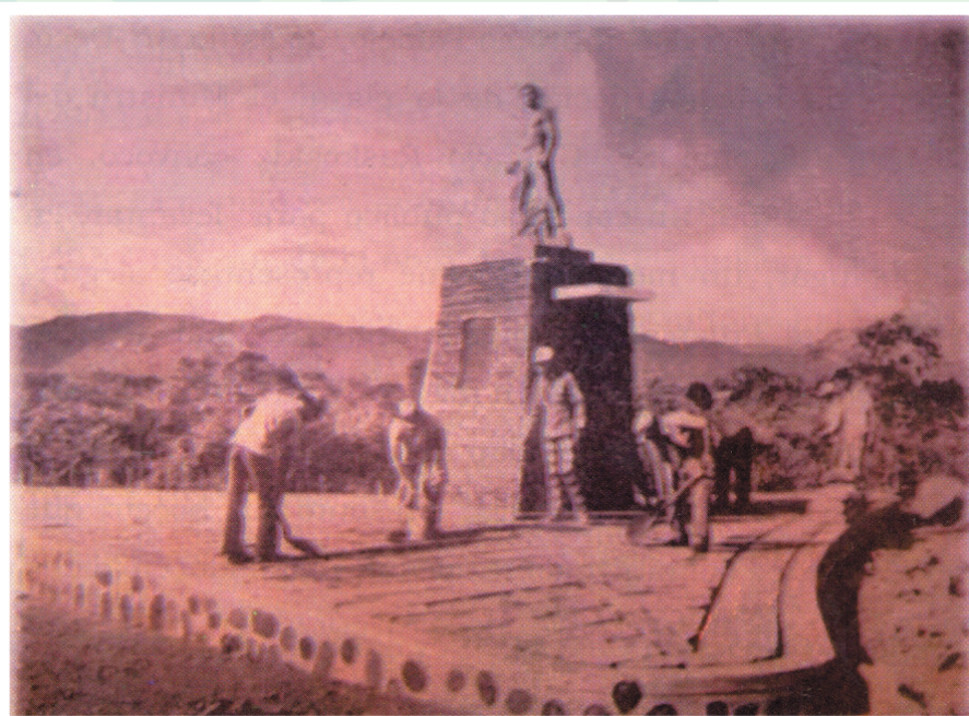
Foto de la época en la que unos trabajadores ultiman las obras del monumento a Andrés Castro en el cruce del "Abra" con San Jacinto.