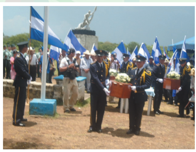
Cadetes del Ejército de Nicaragua llevan los féretros a su cripta en la Casa Hacienda.