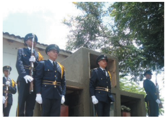
Cadetes del Ejército de Nicaragua hacen guardia de honor en la cripta de los indios flecheros.