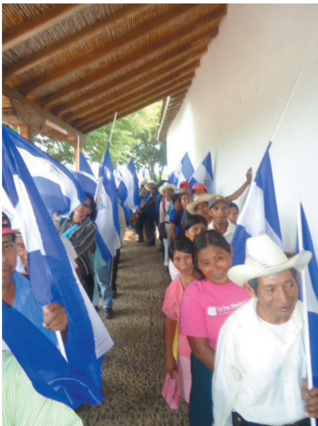
La comunidad indígena Matagalpa, visita la Casa Hacienda San Jacinto.