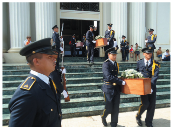
Cadetes del Ejército de Nicaragua, sacan los féretros de los indios Matagalpa del Palacio Nacional de la Cultura.