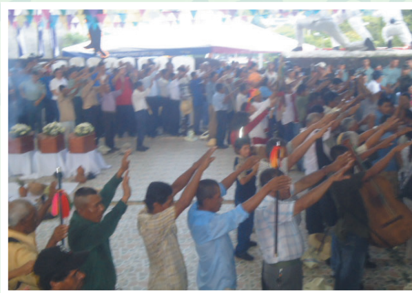
La Comunidad Indígena Matagalpa, rinde homenaje a sus ancestros en la ciudad de Matagalpa.