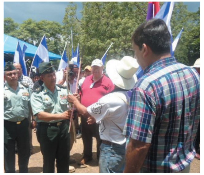
Autoridades del Consejo de Ancianos Matagalpa, entregan un arco y flecha tradicionales a los representantes del Ejército de Nicaragua.