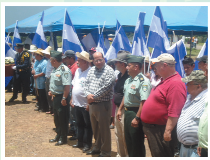
Autoridades municipales de Matagalpa, Tipitapa y Managua; civiles y militares, reciben los restos mortales de los indios flecheros Matagalpa en la Casa Hacienda San Jacinto.