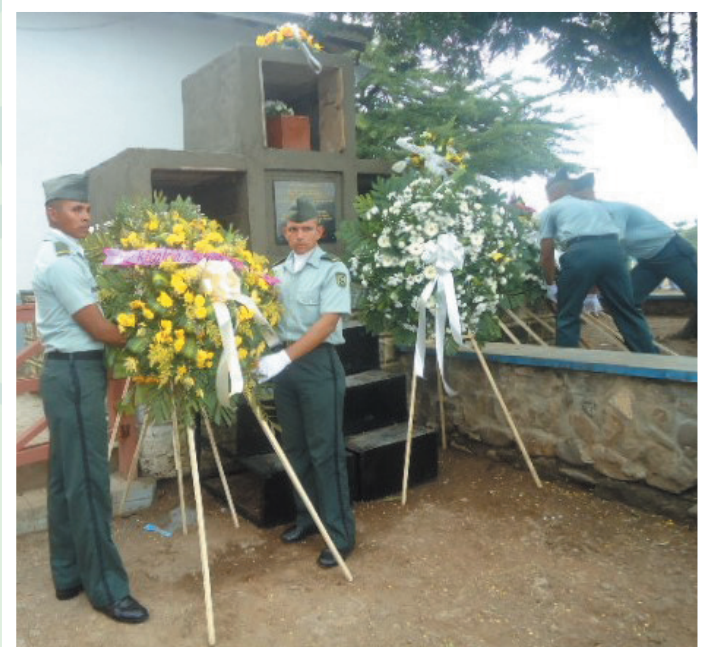
Flores para los héroes.