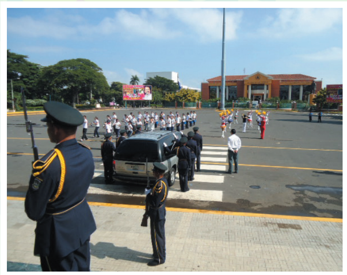
La plaza de la revolución.