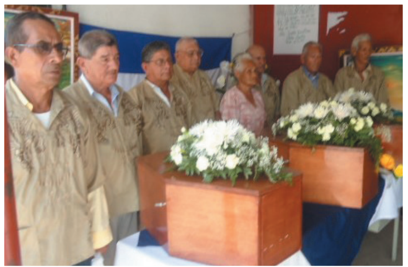
El Consejo de Ancianos de la Comunidad Indígena de Sébaco, Matagalpa, rinden guardia de honor a los indios flecheros Matagalpa, a su paso por la ciudad de Sébaco.