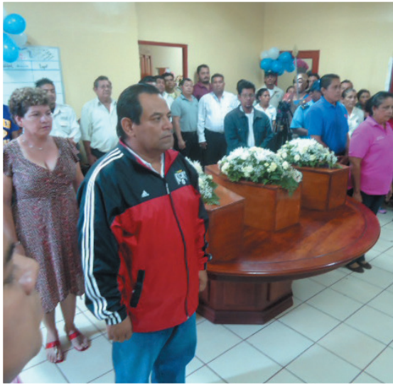
El Gobierno Municipal de Tipitapa, hace guardia de honor a los indios Matagalpa durante su paso por la ciudad de Tipitapa. La Hacienda San Jacinto pertenece a este municipio.