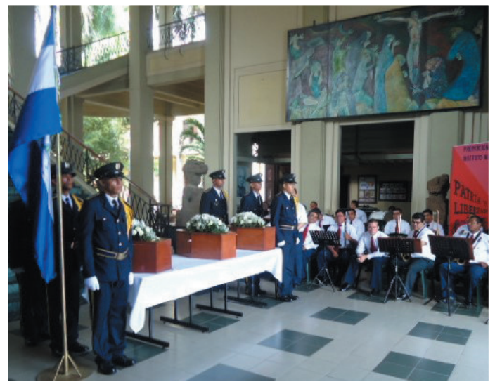
La Banda Municipal de Managua y el cuerpo de cadetes del Ejército de Nicaragua, entonan las notas del Himno Nacional de Nicaragua, para despedir a los indios Matagalpa del Palacio Nacional de la Cultura.