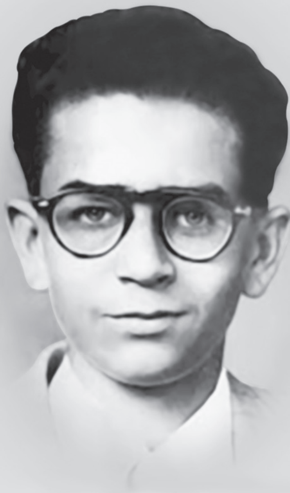
Carlos Fonseca Amador